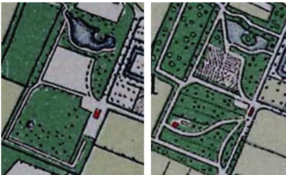
Fig. 3 Detail van het gebied achter Vanenburg met links de situatie op de kaart van 1892 met alleen de kleine vijver linksonder zichtbaar als de wat grotere stip. Rechts op de kaart van 1912 is deze kleine vijver nog kleiner getekend. Maar links daarvan, gelegen aan een nieuw pad, is een rood blokje zichtbaar wat vrijwel zeker de Belvédère voorstelt.

In fig. 3 is het gebied waar de Belvédère stond uitvergroet weergegeven. Duidelijk te zien is dat waar op de kaart uit 1892 alleen de kleine vijver uit de routebeschrijving is te zien, er op de kaart uit 1912 een rood blokje naast is getekend. Dit moet een bouwwerk zijn. Ook zien we dat er extra (slinger)paden zijn aangelegd. Overigens vooral tussen de Vanenburg en het spoor. Ik heb van horen zeggen dat de eigenaresse barones Van Pallandt daar dagelijks met een ezelswagentje een tochtje maakte. Zij overleed in 1917 kinderloos. Haar neef "Joep" van Pallandt heeft het erfgoed geheel verkwest met gokken en feesten. De Vanenburg is in delen verkocht en de fraaie tuinen van weleer grotendeels omgezet in weiland. Van de kleine vijver en de plek van de Belvédère is niets meer te vinden. Ook zijn vrijwel alle paden verdwenen. Wel volgt een klompenpad, het Norderpad, grotendeels dezelfde route over het Vanenburg terrein langs de grote vijver en de restanten van de papiermolen-waterval zodat u zelf kunt zien hoe de Vanenburg als landgoed in kleinere vorm voortleeft.