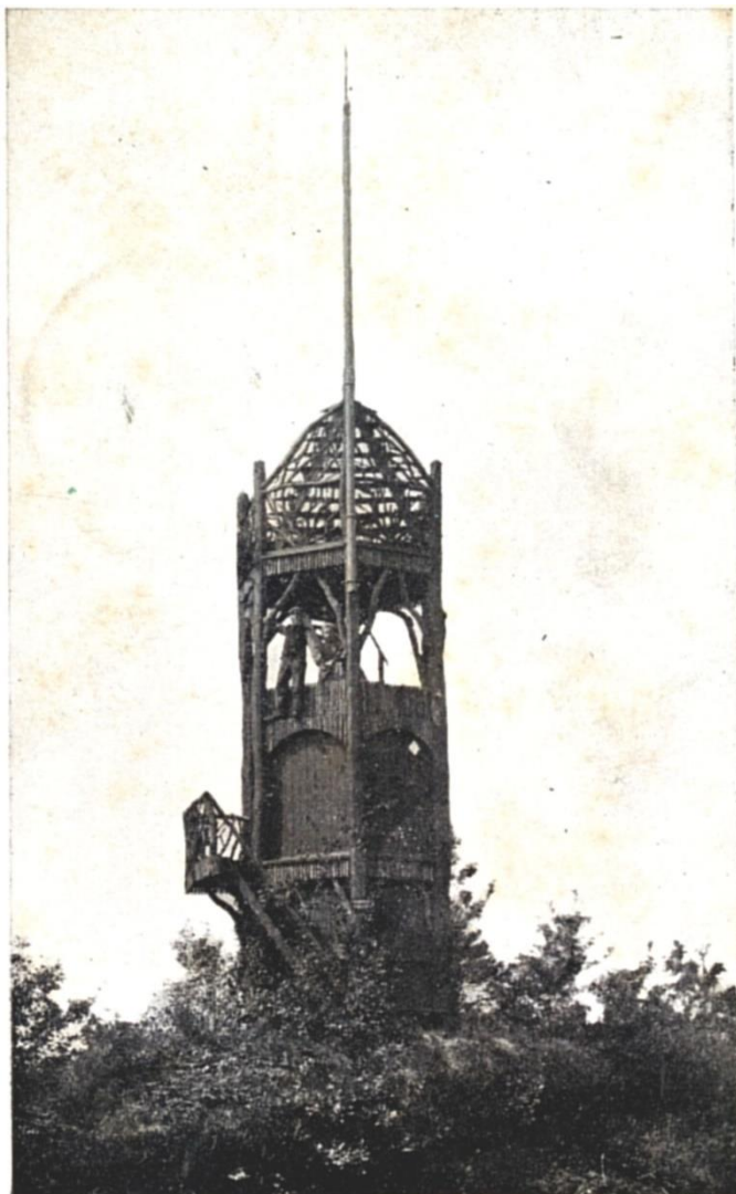
fig. 1 Belvédère op het landgoed Vanenburg, Putten (Veluwe), zoals het onderschrift luidt. Vanwege de togen lijkt het een zeskantige gemetselde toren, maar bij nadere inspectie zijn het planken. Het object in het midden omhoog zal een vlaggenmast schuin naar ons toe gericht zijn. Er is een suggestie van een dak, maar dat lijkt enkel uit ruwe takken te bestaan. Op de onderverdieping zijn twee manspersonen zichtbaar waarvan er een heel stoer buitenboord hangt. Met de trap buiten om zullen ze boven zijn gekomen. Rechts van de mannen is door de opening te zien dat de trap nog hoger doorloopt tot onder de takkenkoepel. Dat is voor de echte durfballen.

Dit keer ter afwisseling een kort en wat toegankelijker verhaal over de recente historie van Putten. Vooral na de aanleg van de spoorlijn in 1863 is toerisme voor Putten van belang geworden voor de werkgelegenheid. Het spoor was in die tijd, voor de opkomst van de auto, een betaalbaar en snel middel om vanuit het drukke westen de rust te vinden op de Veluwe met zijn uitgestrekte bos en heidevelden. Om in het pre-smartphone tijdperk de familie thuis te laten weten dat men goed was aangekomen en alles naar wens verliep stuurde men vaak een prentbriefkaart. Deze zijn nog steeds in de belangstelling als verzamelobject, vooral omdat ze nu een inkijkje geven hoe het vroeger was. Een zo'n kaart wekte mijn speciale belangstelling, die geeft een afbeelding van een uitkijktoren weer, de vroegere Belvédère van de Vanenburg (fig. 1). Belvédère betekent letterlijk "mooi uitzicht". Er is buiten deze ansichtkaart over deze uitkijktoren weinig bekend. Niet wanneer hij is gebouwd, niet wanneer hij is afgebroken of omgewaaid, zelfs de plek staat niet vast. Er leven geen mensen meer die hem hebben gezien en de plek kunnen aanwijzen. Mijn medevrijwilligers hadden het vermoeden dat een stipje op een kaart van begin 1900 misschien een aanduiding ervan was. Zoekwerk op andere oude kaarten en luchtfoto's bracht weinig helderheid tot dat ik een oude gids er op na sloeg. Deze gids was in 1908 uitgegeven om het toerisme in Putten te bevorderen. 1