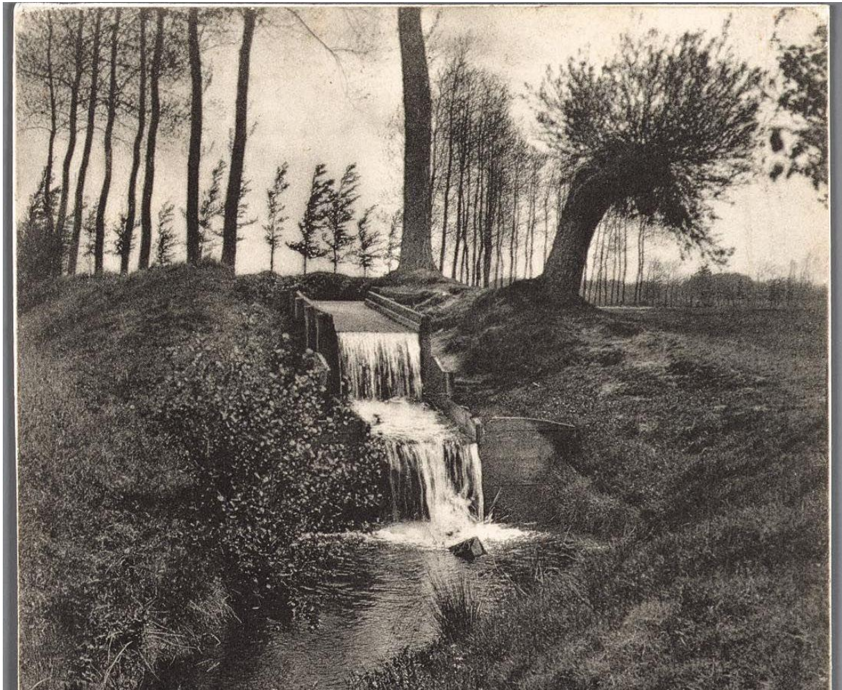
fig. 4 De waterval bij Vanenburg aan de huidige Engersteeg ergens begin 1900. De beek werd in 1661 gegraven voor de aandrijving van de papiermolen. De waterval is een restant hiervan. Merk op dat de aanvoer van het water met dijkjes boven het maaiveld uitkomt. Zo'n zogenaamde opgeleide beek maakte het verval maximaal, zodat er veel energie kon worden opgewekt.