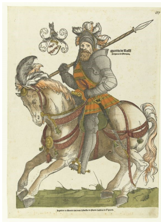
Fig. 2 Maarschalk Maarten van Rossem op zijn paard.