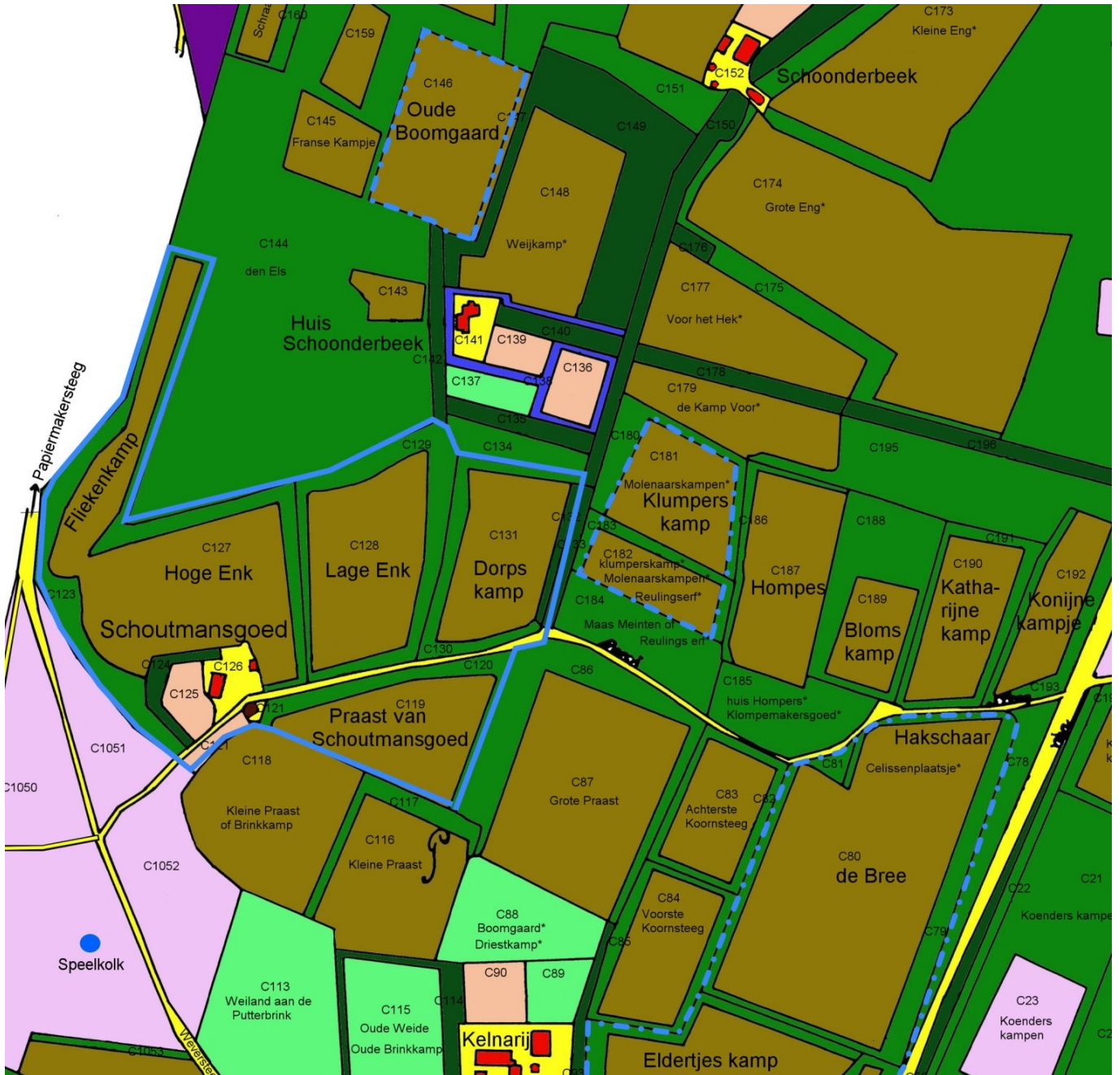
Fig. 1. Schoutmansgoed aan de Putterbrink op de kaart van 1832. De vaste percelen zijn blauw omlind. Percelen uit Schoonderbeek gekomen zijn blauw gestippeld. De Eldertjes kamp rechtsonder is afgekap, maar liep ongeveer tot het Puttertje. Linksonder in lichtpaars de Putterbrink met daarover de Weversteeg en Papiermakersteeg (nu Telgterweg). De schuine weg rechtsonder is de Harderwijkerstraat. Op https://historieputten.vandekraats.com/ kunt u uitgebreidere kaarten van Putten bekijken en downloaden.

voor in de plaats gekomen, het dak van de hooiberg is “naakt”, een bergroede is omgevallen, het boerenhuis van Schoonderbeek is slecht. Er zijn ook zonder toestemming eikenbomen verkocht als bergroeden, o.a. vier bergroeden aan Van Dompsele op (boerderij) de Peppelbomen.