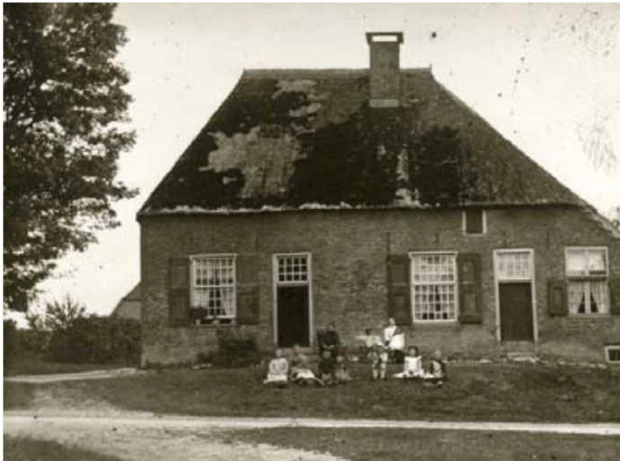
Fig. 3 Het Jachthuis te Hoog-Soeren omstreeks 1900, zo te zien geen enorm paleisachtig gebouw.

Voor hoe het huis er heeft uitgezien kunnen we misschien een vergelijking maken met het Jachthuis te Hoog-Soeren waarvan nog een foto bestaat van omstreeks 1900 (fig. 3). Een dergelijk gebouw zou gemakkelijk gestaan kunnen hebben op de percelen van baron Hompesch.