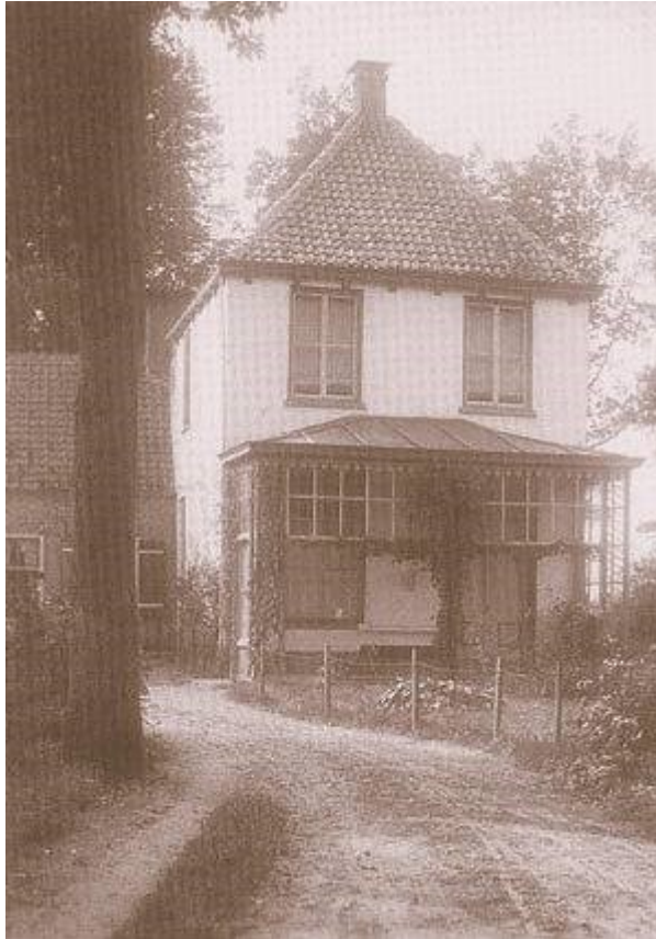
Fig. 1 Schoonderbeek met een later aangebouwde serre, vermoedelijk voor de Tweede Wereldoorlog.