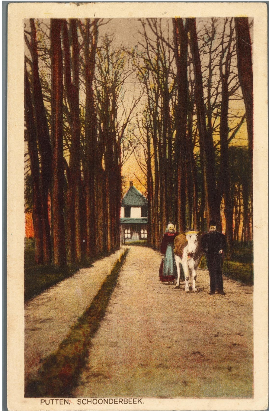
Fig. 3 Ingekleurde foto van Schoonderbeek met nog een mooie laan ervoor, vermoedelijk rond 1900

Er komt ook een brief aan de heren van de orde van het Gulden Vlies boven water, geschreven te Putten in 1556 door Ismeria en Catharina van Gelre van wegen hun overleden zuster Anna. Hoe moeten wij als arme mensen nu verder? Er wordt overwogen de timmerije op het huis Schoonderbeek te verkopen. De datum van 1556 doet vermoeden dat het meer genoemde jaar 1557 van de dood van Anna bijgesteld moet worden.