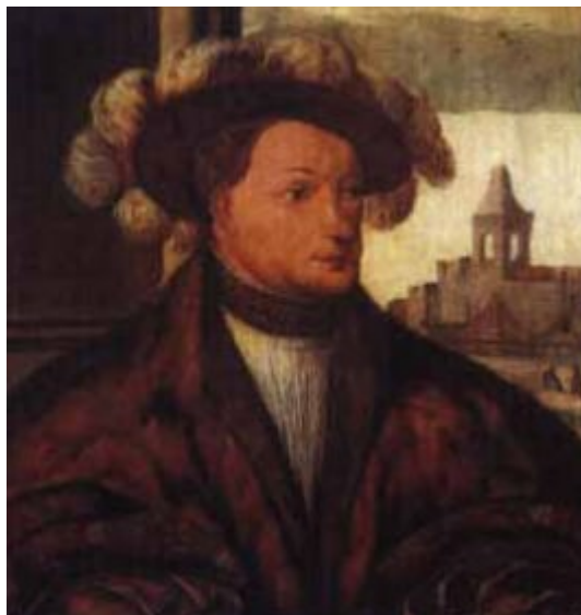
Fig. 4 Hertog Karel van Gelre 1467-1538, hij regeerde van 1492 tot 1538. Zijn vader was Adolf van Egmond en zijn moeder Catharina van Bourbon