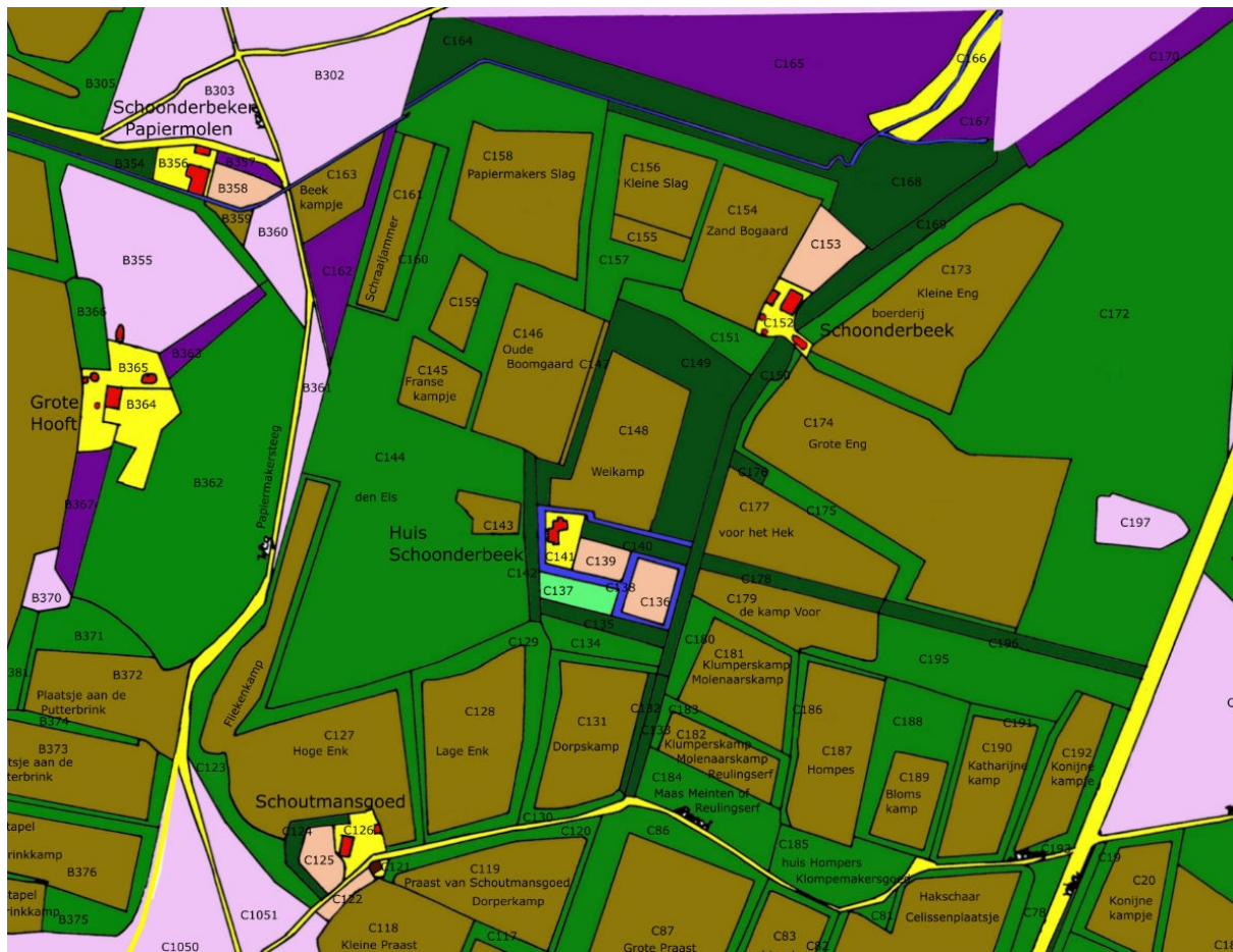
Fig. 2 Schoonderbeek met omgeving in 1832. De schuine weg rechts is de Harderwijkerstraat. Daar vandaan loopt er een oprijlaan met hoge bomen tot het huis Schoonderbeek (donkergroen). Ik herinner me daar nog het feestterrein met de kermis. Let ook op de grachten. De rondweg om Putten heen als onderdeel van de weg Ermelo-Nijkerk die de grachten zouden gaan doorsnijden was er nog niet. Schoutmansgoed is nu veranderd in de begraafplaats Schootmanshof. Links de Telgterweg met bovenaan de Schoonderbeker papiermolen, gebouwd in 1691, aan het begin van de Beekweg. Zie ook de sprengen van de Schoonderbeek op het Zuiderveld boven de boerderij Schoonderbeek.

schaapschot, de stal, de grachten zijn er buiten gebleven. Zo ook de ontginning van het land eromheen wat tot 'zware kosten' heeft geleid. We kunnen ons afvragen wat met deze singel bedoeld wordt, kennelijk een soort van stenen muur als omheining.