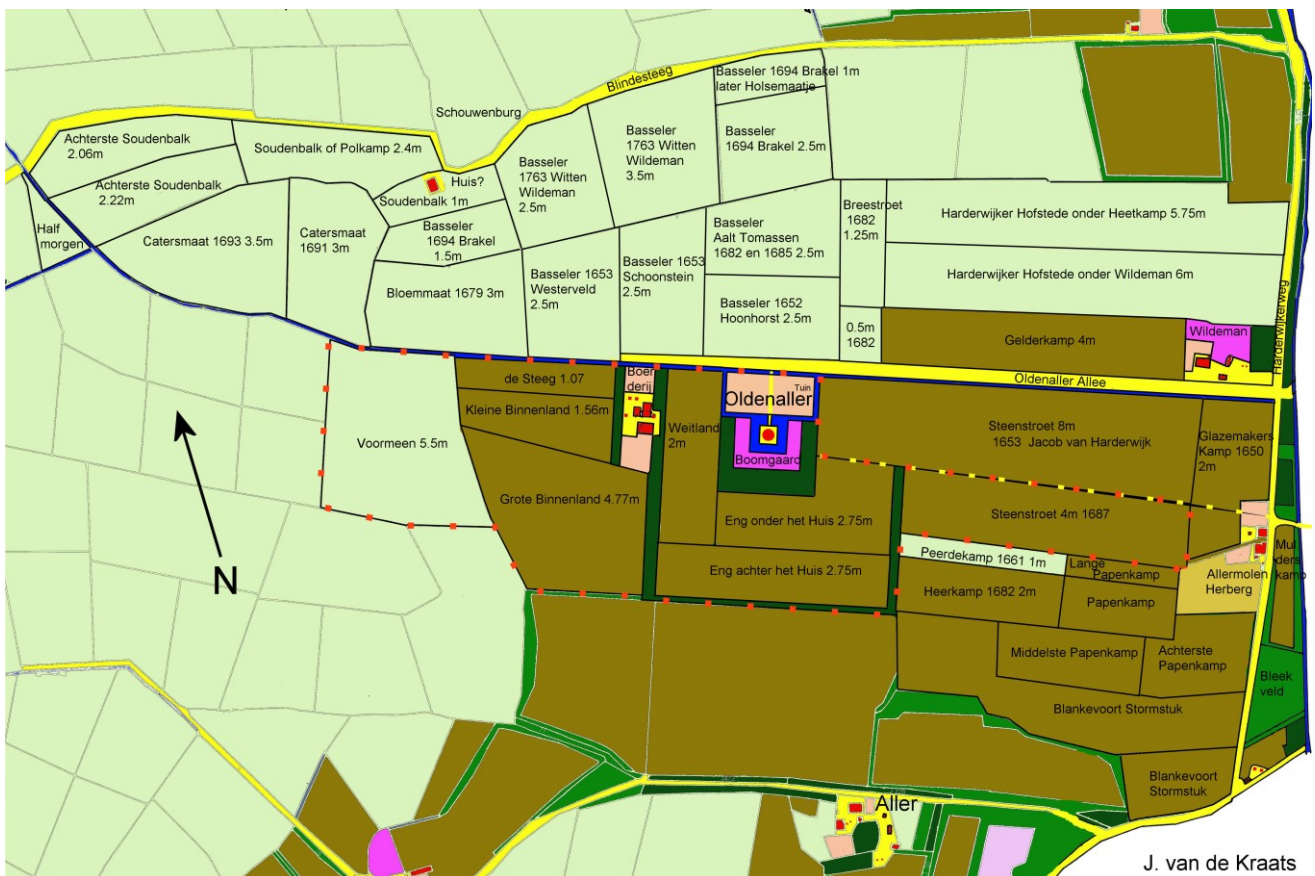
Fig. 2 Reconstructie percelen Oldenaller van ca 1575 tot ca 1775. Bouwland is bruin, weiland is zachtgroen volgens gegevens uit 1832. De weg horizontaal in het midden is de Oldenaller Allee. De weg daar boven is de Blindesteeg. De weg van beneden naar boven aan de rechterkant is de Harderwijkerweg, het bovenste deel is nu de Waterweg, het onderste deel de Allermolenweg. Daaraan ligt de Allermolen Herberg met daarvoor nog een klein stukje van de vroegere Molenweg richting Putten (de Allermolen is net buiten beeld). De gele stippellijn geeft mogelijk de oude toegangsweg vanaf de Allermolen tot Oldenaller. Het bezit van Oldenaller in 1575 is binnen de rode stippellijn. De ligging van de oude percelen direct om het Spijker zijn onzeker. De percelen van Oldenaller in de latere situatie zijn allemaal zwart omlind en hebben tekst. Vergelijk met de situatie in 1849 in fig.4 voor de nieuwe indeling van de Basselers en de aanleg van de Zuiderzeestraatweg naar Nijkerk.