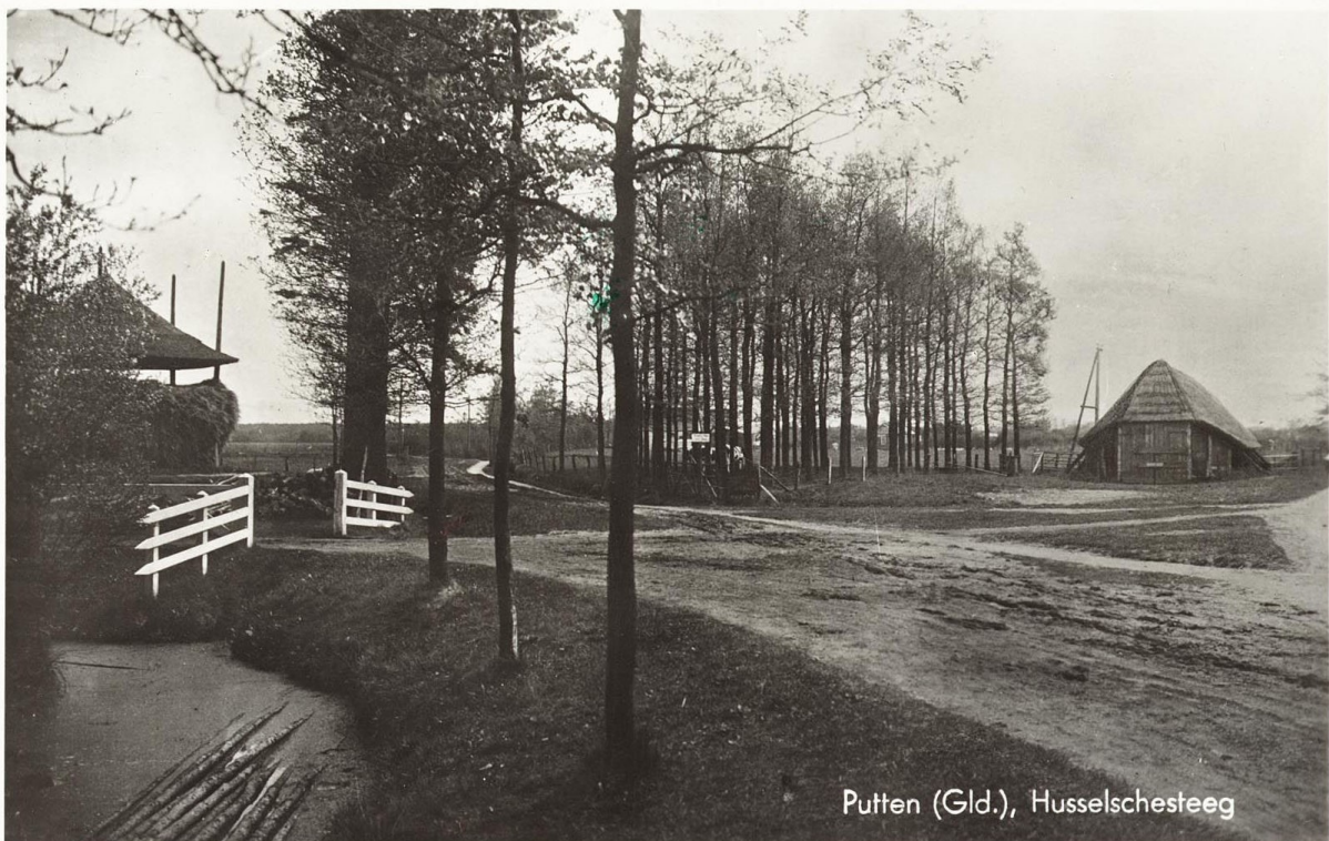
Putten (Gld.), Husselschesteeg