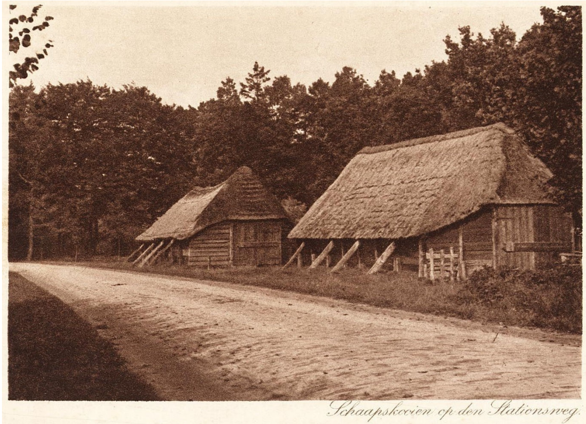
Fig. 1 Toen er nog twee schaapskooien stonden bij Hussel. De weg ervoor is nu de Stationsstraat. Achter de bomen ligt het erf Hussel.