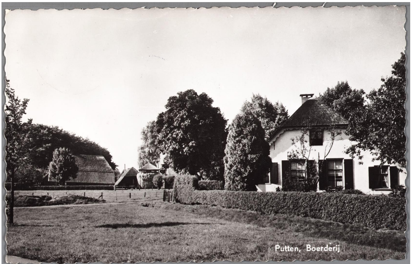
Fig. 4 Ansichtkaart van boerderij de Putterbrink zoals we hem nu nog duidelijk herkennen. De eigenlijke maar inmiddels vergeten naam was dus Hegemansgoed. Links op de achtergrond boerderij Colengood met zijn karakteristieke naar achteren aflopende dak. De foto moet genomen zijn vanaf de oude Rijksweg.