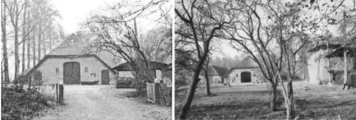
Fig. 3 Linker foto: de Kleine Roest met hooiberg en toegang vanaf de Beekweg, rechter foto: de minder bekende achterzijde van de Grote Roest nog met hooibergen en links het schaapschot. Foto's uit de jaren zestig.