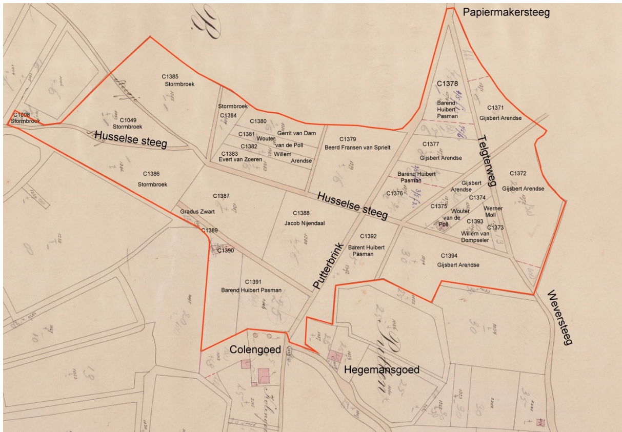
fig. 3. De Putterbrink, rood omcirkelt, op een kaart uit 1881 met percelen en hun eigenaren na de verdeling uit 1841. Het gebied is ter wille van de leesbaarheid wat kleiner gekozen dan in fig. 2. Let op de kaarsrechte wegen in het plangebied.