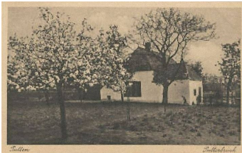
Fig. 4. Op perceel C1374 is tussen 1841 en 1852 een huisje gebouwd door Wouter van de Poll en Harmpje Arentse. Daar is nog een wazige foto van bewaard gebleven voor dat het afgebrand is. Het was een voorganger van het huis van Pasman bij het begin van de Husselsesteeg.