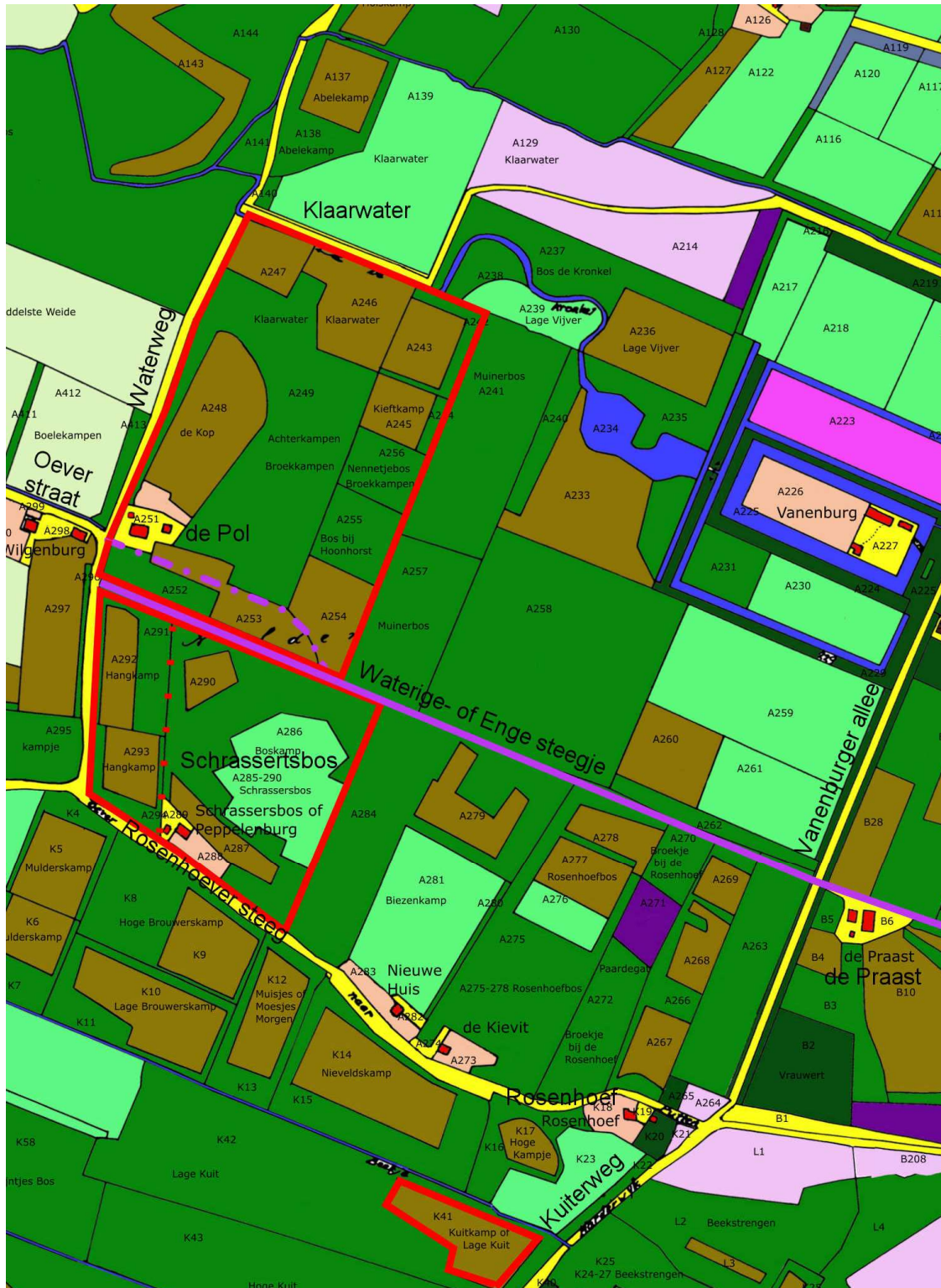
Fig. 2 Kaart van 1832 met rood omlind het gebied De Pol, noordelijk, en Schrassertsbos, zuidelijk van het Waterige of Enge steegje (in paars). De Rosenhoeversteeg heet nu de Zuiderzeestraatweg. Het gestippelde paarse tracé over het erf van de Pol lijkt een oude route te zijn. Westelijk van de stippellijn in het Schrassertsbos liggen de beide Hangkampen. De Vanenburg lag in 1531 nog ten westen van de Waterweg en ten noorden van de 't Oeverstraat. Geheel beneden de morgen ten zuiden van de Rosenhoef.