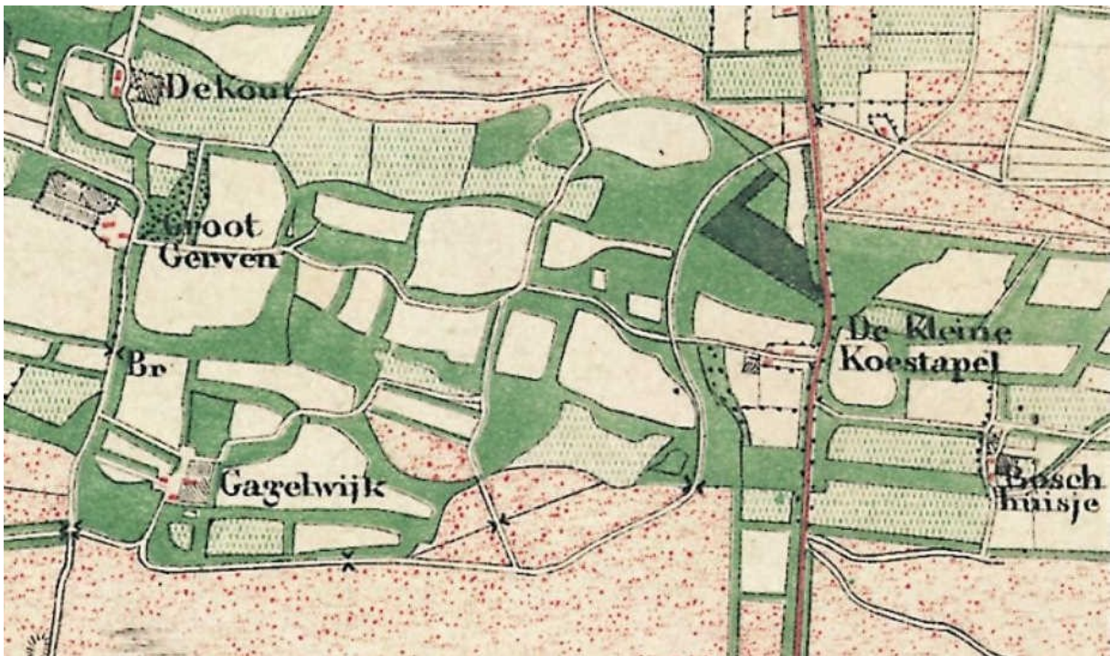
Fig. 3 De kaart van 1872. De topografische Dienst houdt nog keurig de originele namen aan van Klein Koestapel en het Boshuisje. Boerderij Groot Koestapel is verdwenen. Na de Tweede Wereldoorlog geven ze zich gewonnen en staat er Groot Koestapel bij de plek van boerderij Klein Koestapel.