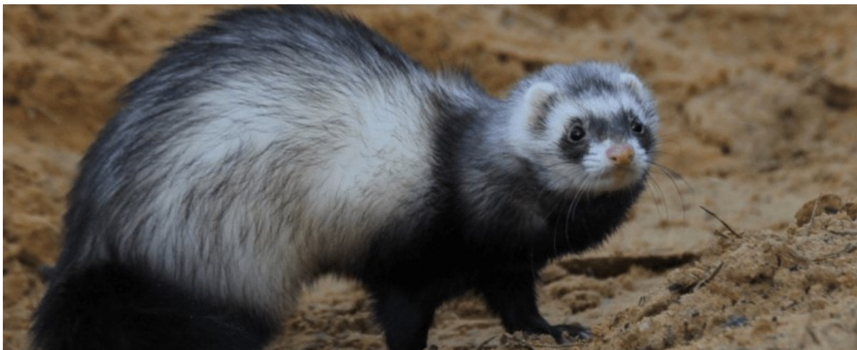
Fig. 1. Een fret.

Een toelichting wat fretteren inhoudt is in deze tijd waarschijnlijk niet overbodig. Konijnen vluchten bij gevaar al snel hun uitgebreide ondergrondse gangenstelsels in. Deze hollen heten ook wel pijpen. Bij het jagen op konijnen wordt een afgerichte fret in een pijp gezet die dan de konijnen via andere pijpen het gangenstelsel uit jaagt. Daar kunnen ze gevangen of geschoten worden. De fret wordt achteraf beloond met een lekkernij zodat hij de konijnen niet zelf gaat doden. De fret is ook vriendelijk voor zijn baasje. Ik hoorde van een vriend van mij dat zijn grootvader de fret gewoon onder zijn jasje tegen zijn borstkas droeg.