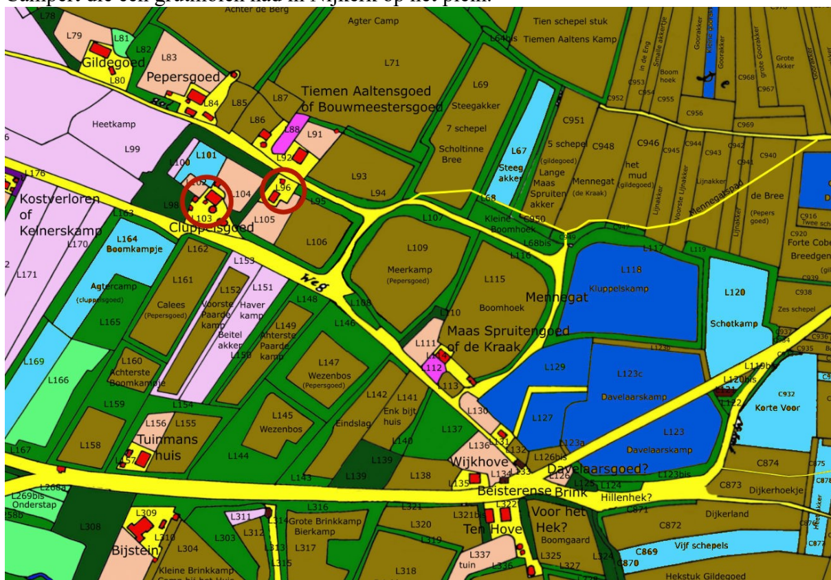
Fig. 2 Een gecompliceerd plaatje op de kaart van 1832. Linksboven het groepje boerderijen uit fig. 1 met Cluppelsgoed in linker rode cirkel en Kleermakersgoed (L96) in rechter rode cirkel. Bruin is bouwland, donkergroen houtwallen. Percelen van Cluppelsgoed zijn lichtblauw gemaakt en die van Davelaarsgoed donkerblauw. Meer percelen liggen verderop in de Puttereng en vallen van de kaart. Onder de weg naar Nijkerk. In 1830 is de weg dwars door Davelaarskamp (donkerblauw) en over de vroegere plek van Davelaarsgoed getrokken. Van het oude gedeelte, wat lager om de kamp heen liep, is de huidige Enghuusweg een overblijfsel. Nog lager onder de Beisterense Brink stond de boerderij Ten Hove met rechts daarvan de vermoedelijke plek van boerderij Voor het Hek. Daar stond het HillenHek over de weg om vee uit de Puttereng te houden.