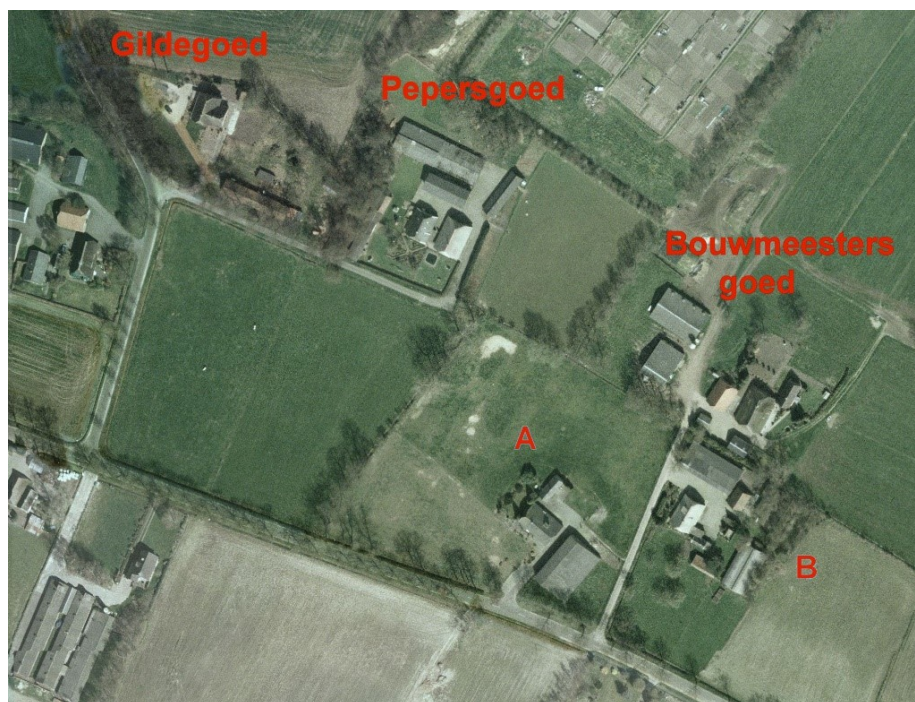
Fig. 1 De boerderijen in een groepje bij elkaar voordat ze door de nieuwbouw zijn ingekapseld. De schuine weg onder is de Stenekamerseweg. Vandaar links naar boven de Rimpelerweg. Behalve Gildegoed, Pepersgoed en Bouwmeestergoed zijn er de lager gelegen boerderijen A en B. A zou Davelaarsgoed zijn en B Cluppelsgoed.