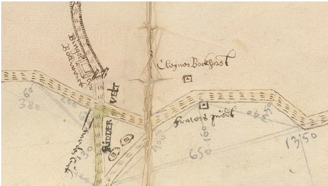
Fig. 3 Linksboven het Bungeler Bolwerk op de kaart van Bernard Kempinck uit 1609. Horizontaal de oude route Putten-Nijkerk tussen Groot Bokhorst en de Grote Tuk door (zie tekst). De naam Ridderveld roept ook weer vragen op.