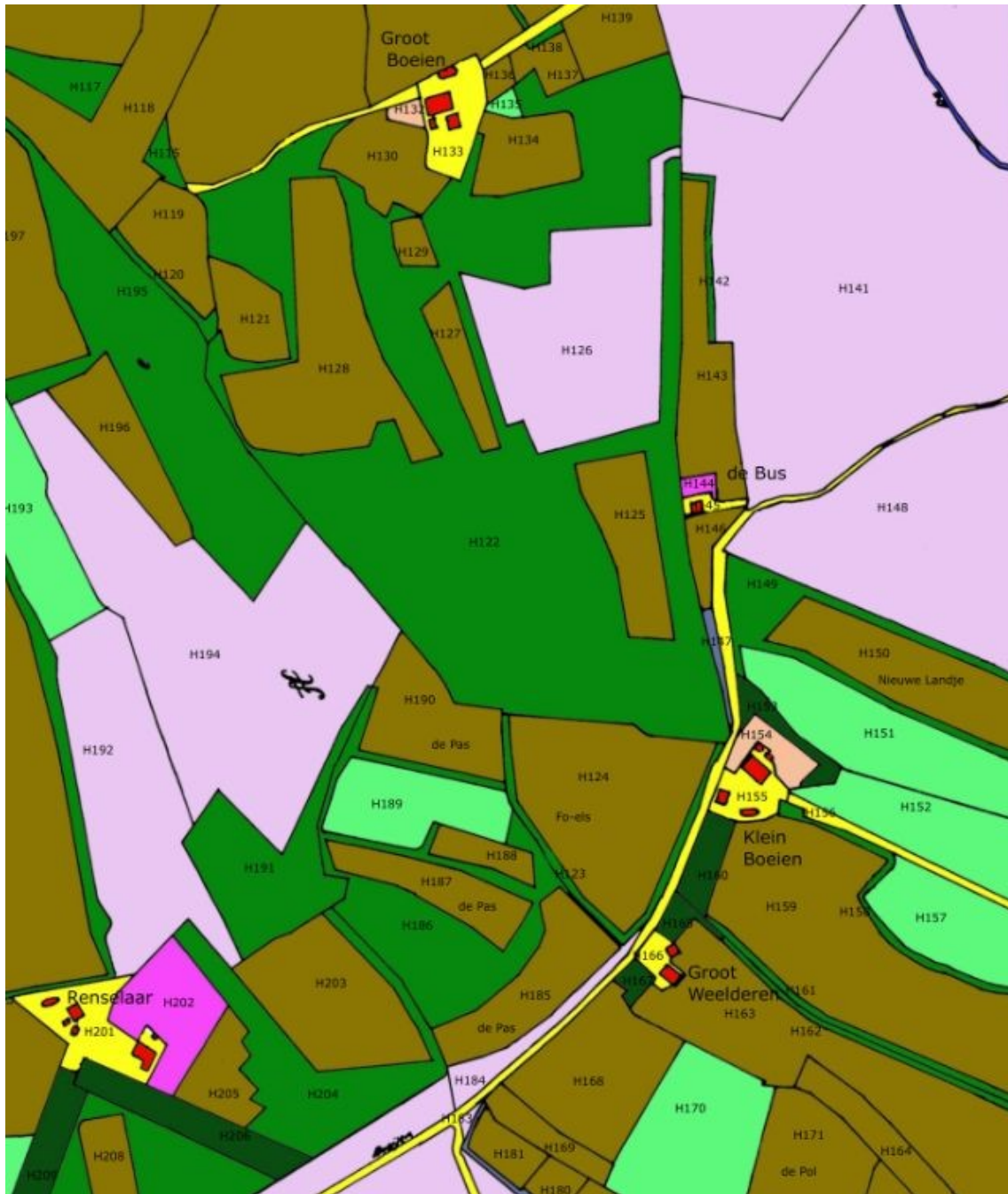
Fig. 2 Het gebied bij boerderij Groot en Klein Boeijen waar zich een bolwerk bevond. Het lichtpaarse heidegebied rechtsboven was van het Huiner maalschap. Links daarvan mogelijk het bolwerk op de plek waar later het inmiddels weer verdwenen erfje de Bus kwam. Het ligt aan de oude zuidelijke route van Nijkerk naar Putten. Geheel linksonder nog de bekende boerderij Renselaar. Voor de hele kaart van Putten zie https://historieputten.vandekraats.com/