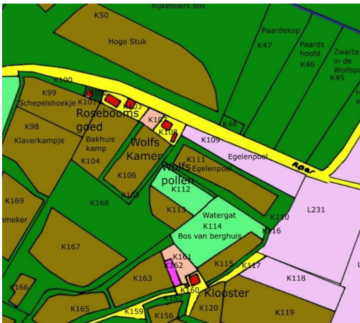
Fig. 1 Het gebied (anno 1832) de Wolfskamer aan de Stenekamerse weg die naar het dorp Putten voert. Geheel rechts is de noordelijke afslag via de Kuiterweg als onderdeel van de oude route naar Harderwijk te zien. Rozeboomsgoed is de boerderij die nu nog pal langs de weg staat. Waar het bolwerk zich exact bevond is moeilijk te zeggen. Boerderij het Klooster is niet naar een oud klooster genoemd maar afgeleid van een persoonsnaam.

De Wolfskamer is een gebied (zie Fig.1) aan de Stenekamerse weg. Het wordt in 1371 al genoemd (GA 0001_2663-0018). Dan is er sprake van ruim 7 morgen land op Wolfskamer. De boerderij westelijk van perceel K106 met die naam gelegen heet nu Roseboomsgoed naar een vroegere eigenaar, maar was oorspronkelijk boerderij de Wolfskamer en staat pal aan de huidige fietsstraat. Het oostelijk gelegen gebied heet de Wolfspollen. Was dit mogelijk een overblijfsel van een oude verdedigingswal tussen Putten en de Zuiderzee? De percelen Watergat en Egelenpoel duiden juist op laag land. Afgegraven ten behoeve van het bolwerk? Aan de overkant van de weg ligt een perceel het Hoge Stuk, dit komt misschien eerder in aanmerking. Ook hier komt meer oostelijk de naam Wolfspollen voor.